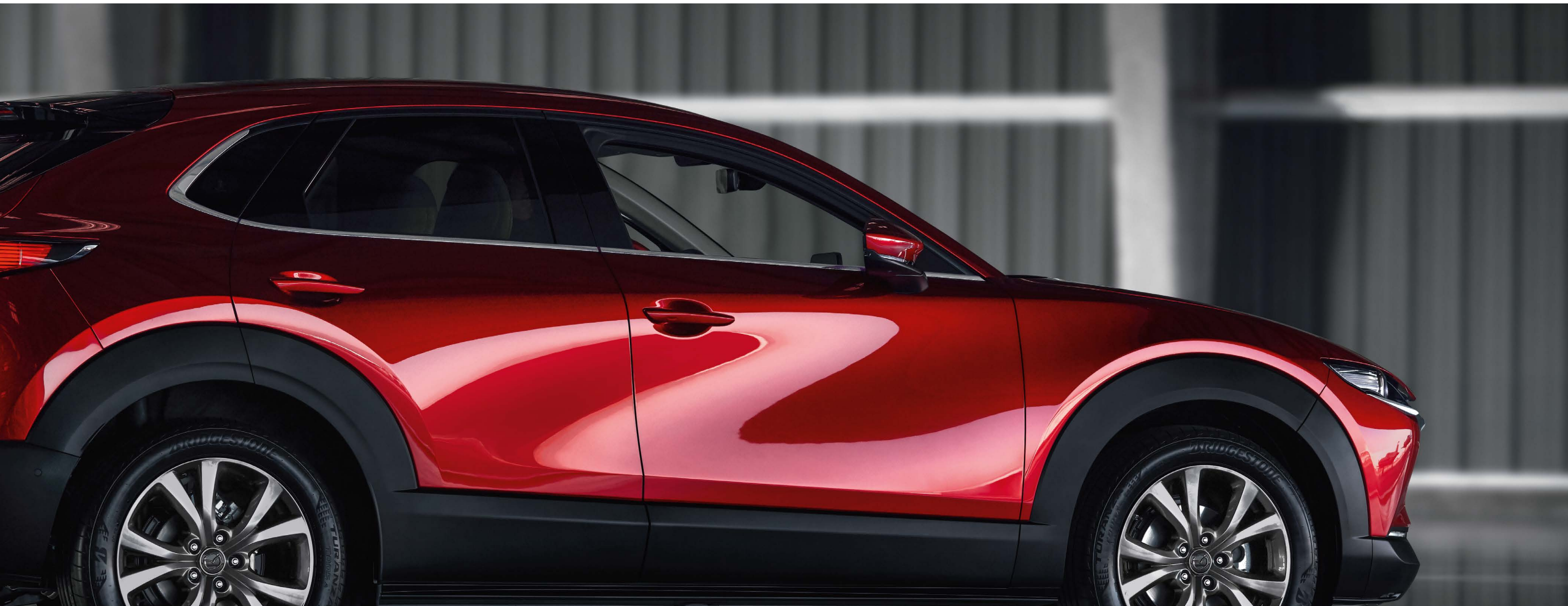
Esta imagem apresenta um Mazda CX-30 na cor Soul Red Crystal e no nível Excellence