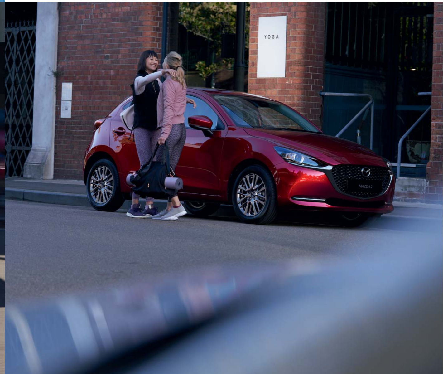
Esta imagem apresenta um Mazda2 em Soul Red Crystal.