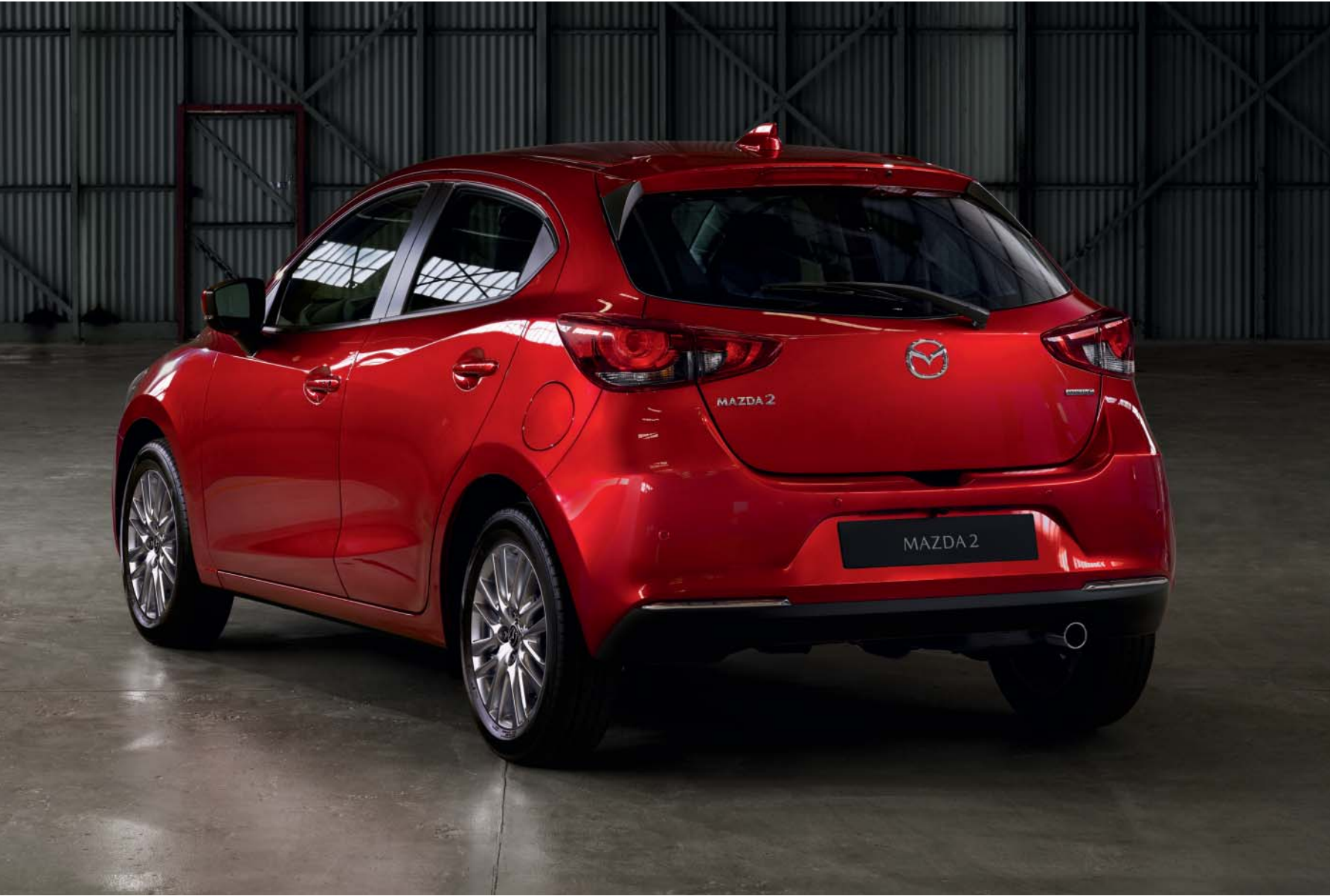
Esta imagem apresenta um Mazda2 em Soul Red Crystal