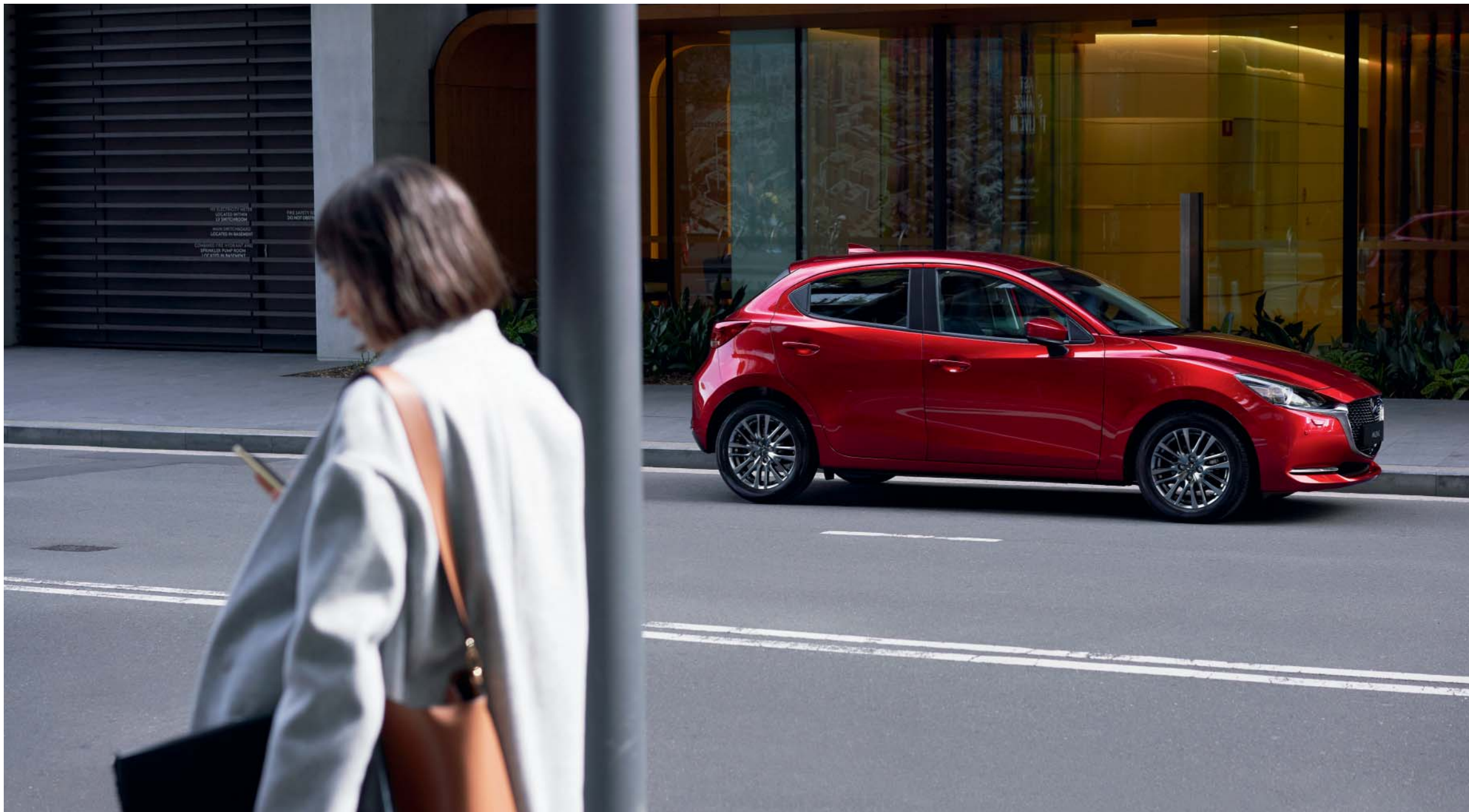
Esta imagem apresenta um Mazda2 em Soul Red Crystal