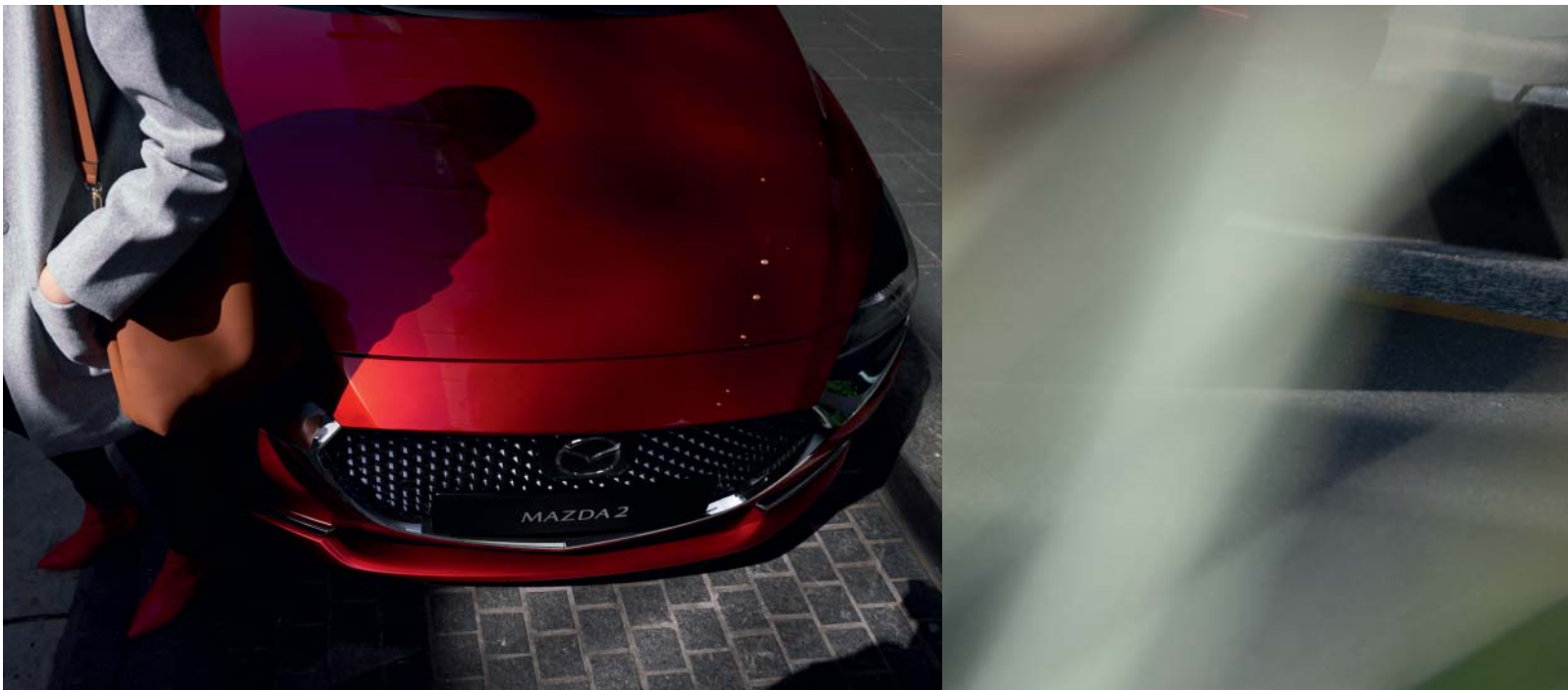
Esta imagem apresenta um Mazda2 em Soul Red Crystal