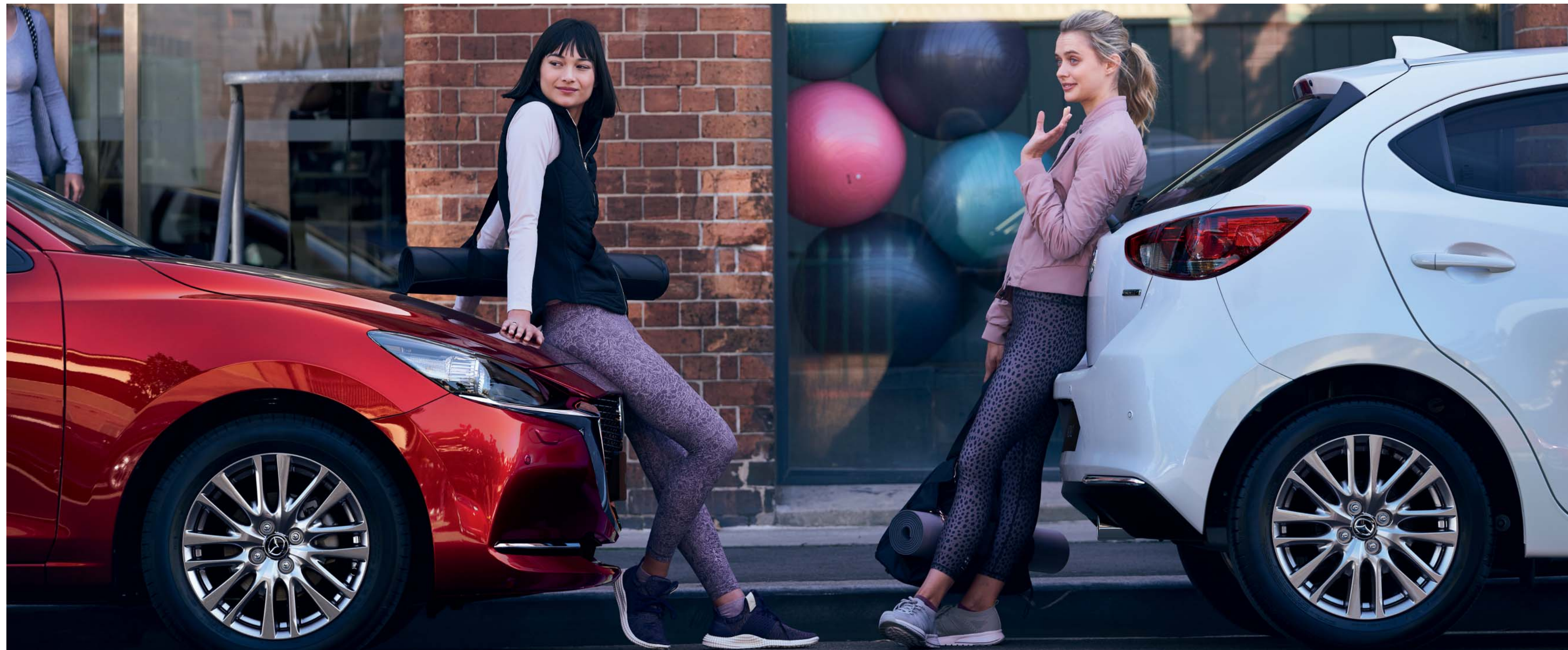
Esta imagem apresenta um Mazda2 em Soul Red Crystal