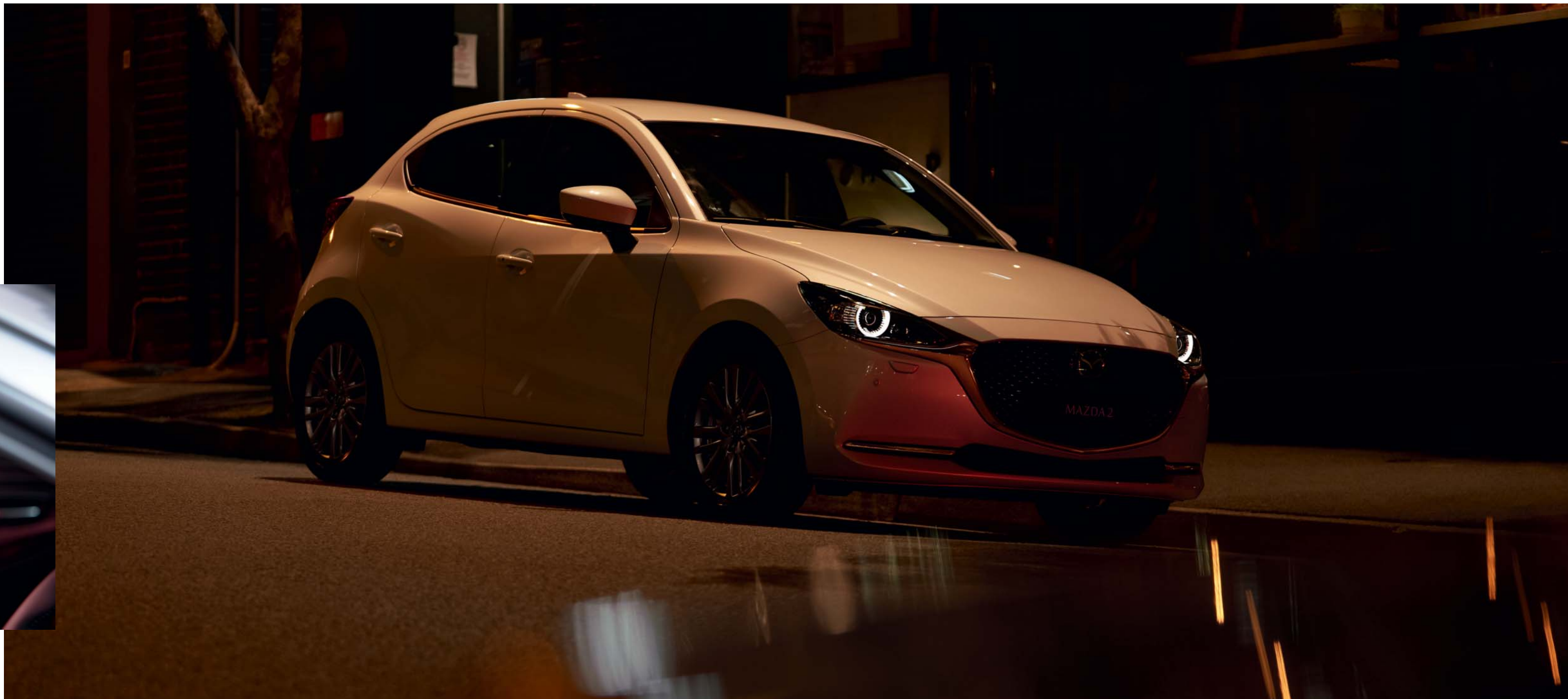
Esta imagem apresenta um Mazda2 em branco pérola,